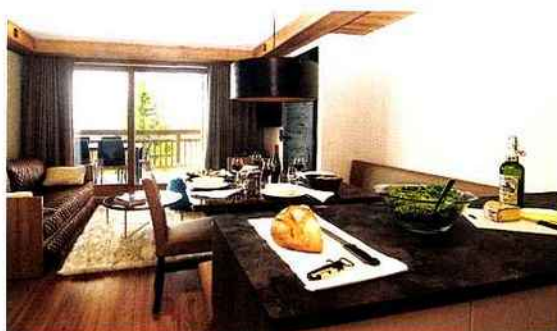
La déco intérieure est signée Hervé Le Fillatre